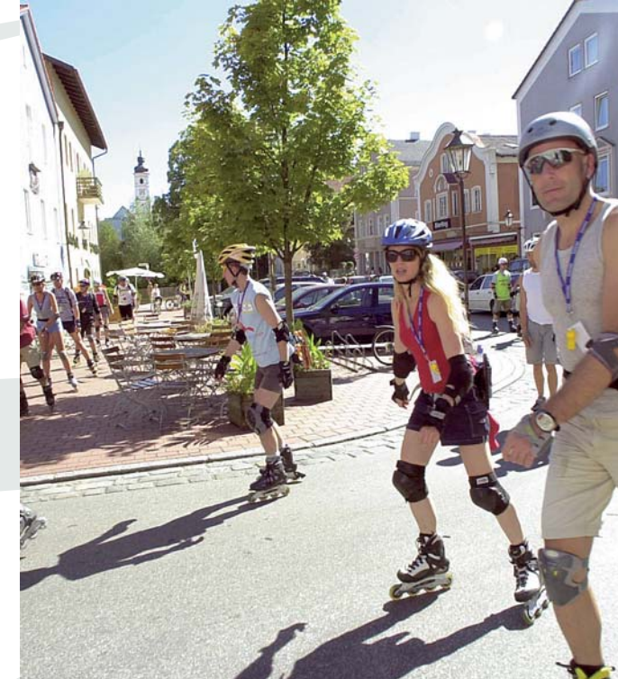
viele Rad- und Wanderwege um Dorfen