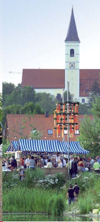
Interessant: Jazz am Weiher