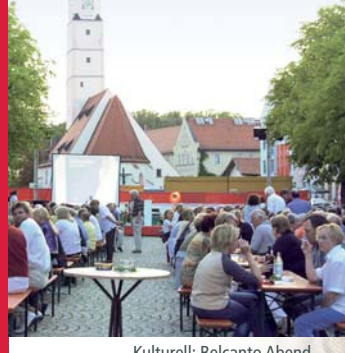
Kulturell: Belcanto Abend