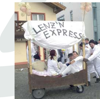
Fasching: Hemadlenz'n Umzug