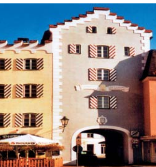
Blick aufs Wesner Tor