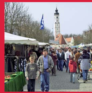
Gut besucht: Fastenmarkt