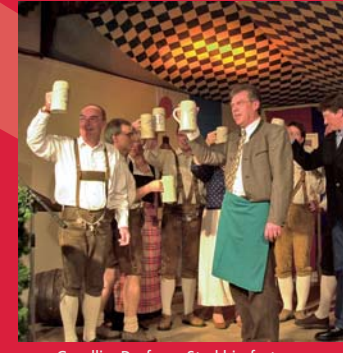
Gesellig: Dorfener Starkbierfest