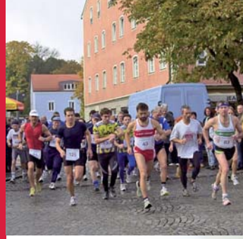
Aktiv: Dorfener Stadtlauf